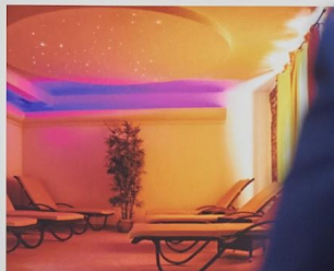
Health and wellness hotels