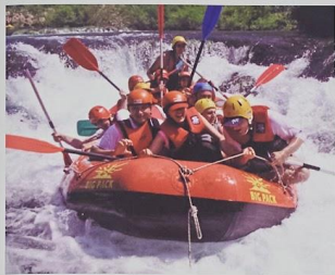
Active and adventure hotels

Association of family and small hotels of Croatia, www.omh.hr , info@omh.hr